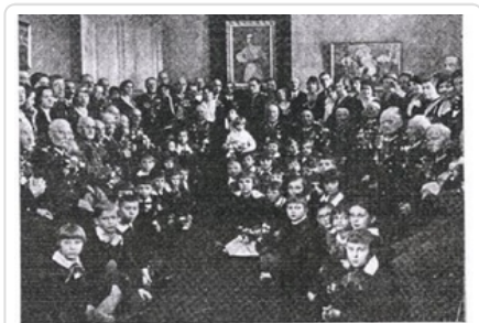
Weterani powstania styczniowego na przyjęciu w kasynie oficerskim w Warszawie.